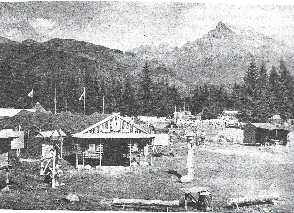
Výstavná štvrt stanového mesta.