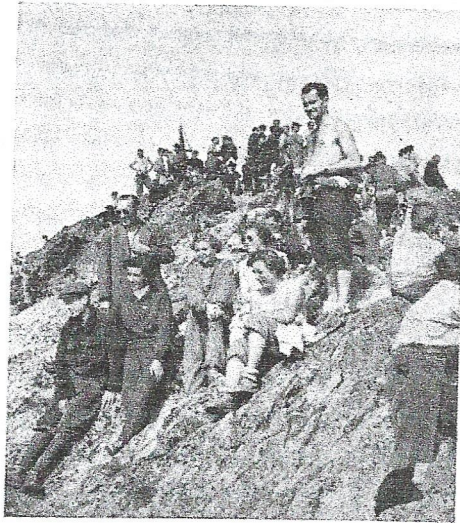
Na vrchole Kriváňa.